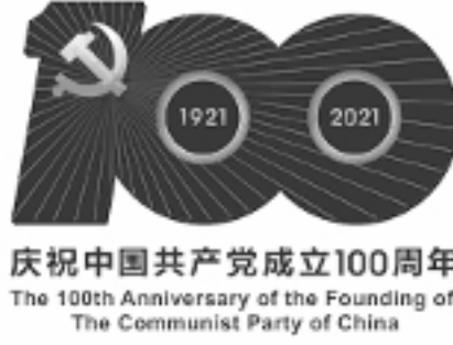
庆祝中国共产党成立100周年 The 100th Anniversary of the Founding of The Communist Party of China

இந்தியக் கம்யூனிஸ்ட் கட்சி (மார்க்சிஸ்ட்), மார்க்சிசம்-லெனினிசம் என்பது ஓர் ஆக்கபூர்வ அறிவியல் (creative science) என்று அடிக்கோடிட்டுக் கூறுவதைத் தொடர்கிறது. இது முற்றிலும் வறட்டுத்தனத்திற்கு எதிரானது. இதனை எல்லாக்காலத்திற்கும் பொருந்தக்கூடிய சூத்திரங்களின் ஒரு தொகுப்பாக எப்போதுமே குறைத்து மதிப்பிட முடியாது. ஓர் ஆக்கபூர்வமான அறிவியல் என்ற முறையில், அதன் புரட்சிகரமான கொள்கைகளையும், மக்களை அடிமைத்தனங்களிலிருந்து விடுவிப்பதற்கான நோக்கங்களையும் கறாராகப் பின்பற்றும் அதேசமயத்தில்,